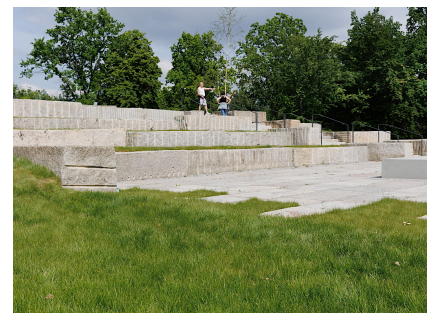
Das Parktheater mit Aussicht über den Park