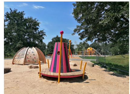
Die Spiellandschaft ist bereits fertig

Machbarkeitsstudie 2018, Planung seit 2019, Realisierung: 2021-2025