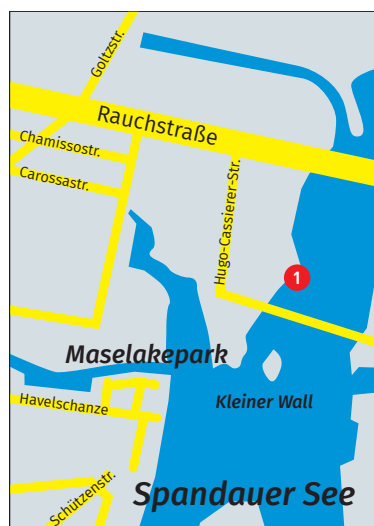
Der Spielplatz liegt zwischen den beiden Brücken am Havelufer.

Hakenfelde. An der Havelspitze direkt neben der Havel kann nun endlich auch gespielt werden.