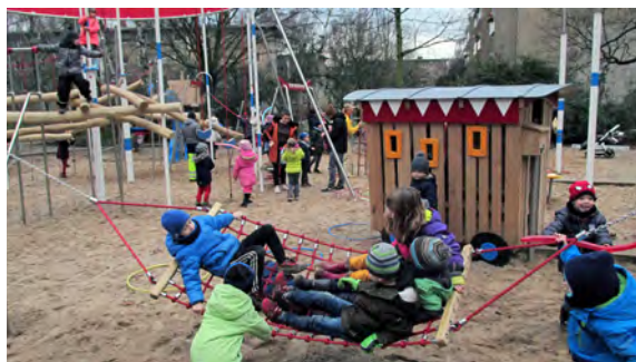
Die Kinder spielen ausgelassen auf dem neuen Spielplatz

Die Spielgeräte auf dem Spielplatz Neuhausweg im Grünzug der Georg-Ramin-Siedlung sind in die Jahre gekommen und mussten aus Verkehrssicherungsgründen abgebaut werden.