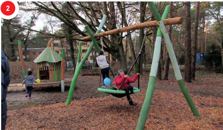
Endlich neue Spielangebote auf dem Spielplatz Waldschluchtpfad