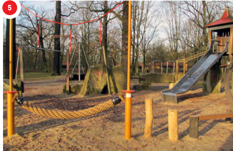
Die Charlottenburger Baugenossenschaft eG ermöglicht ein verbessertes Spielangebot auf dem Spielplatz der „Zwergenwelt“

Im Rahmen des Projektes „Raum für Kinderträume“ konnte dank der großzügigen Unterstützung des Projektpartners Charlottenburger Baugenossenschaft eG der Spielbereich auf dem „Zwergenwelt“-Spielplatz Hakenfelder Straße im Waldpark Hakenfelde verbessert werden.